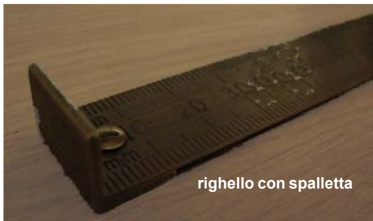
righello con spalletta