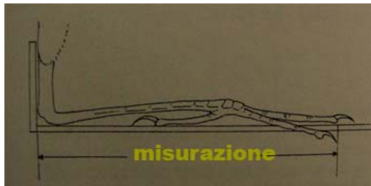
Figura 2: misurazione tarso + piede con righello

Nella pagina seguente pubblichiamo il facsimile della scheda da riempire con i dati biometrici.